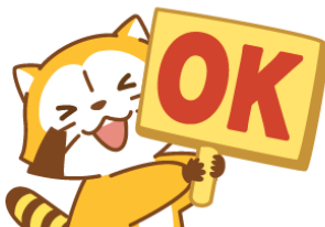
▲ラスカルのLINEスタンプ

これをきっかけにコラボが決定し、「羅巢華流團」が誕生しました。昨年の「氣志團万博2015」の開催を記念して発売した「羅巢華流團バームクーヘン」が大人気を博し、2年連続でのコラボレーションが決定しました。