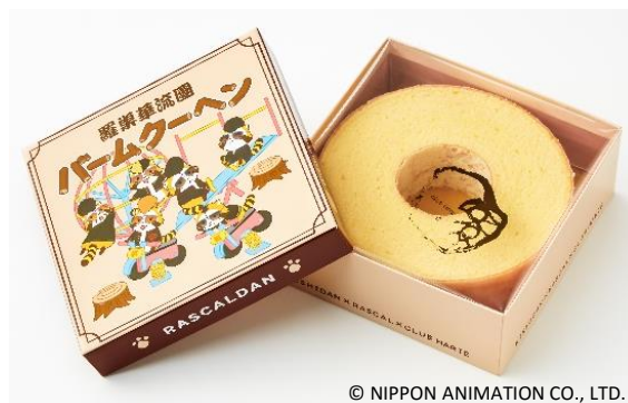
第4弾(2015年) ※「ラスカル」と初めてコラボしたパッケージ

※次のページに、「氣志團」「クラブハリエ」「ラスカル」の参考資料をご用意しています※