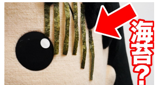
▲ これまでに配信した動画の一部