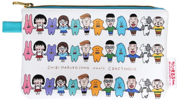
フラットポーチ(1,700円+税)