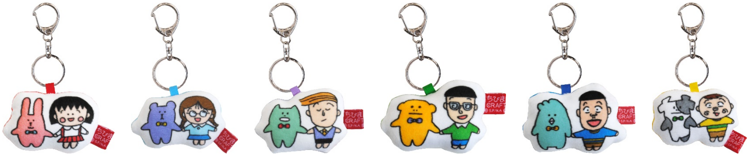
もちもちダイカットキーホルダー(全6種・各800円+税)