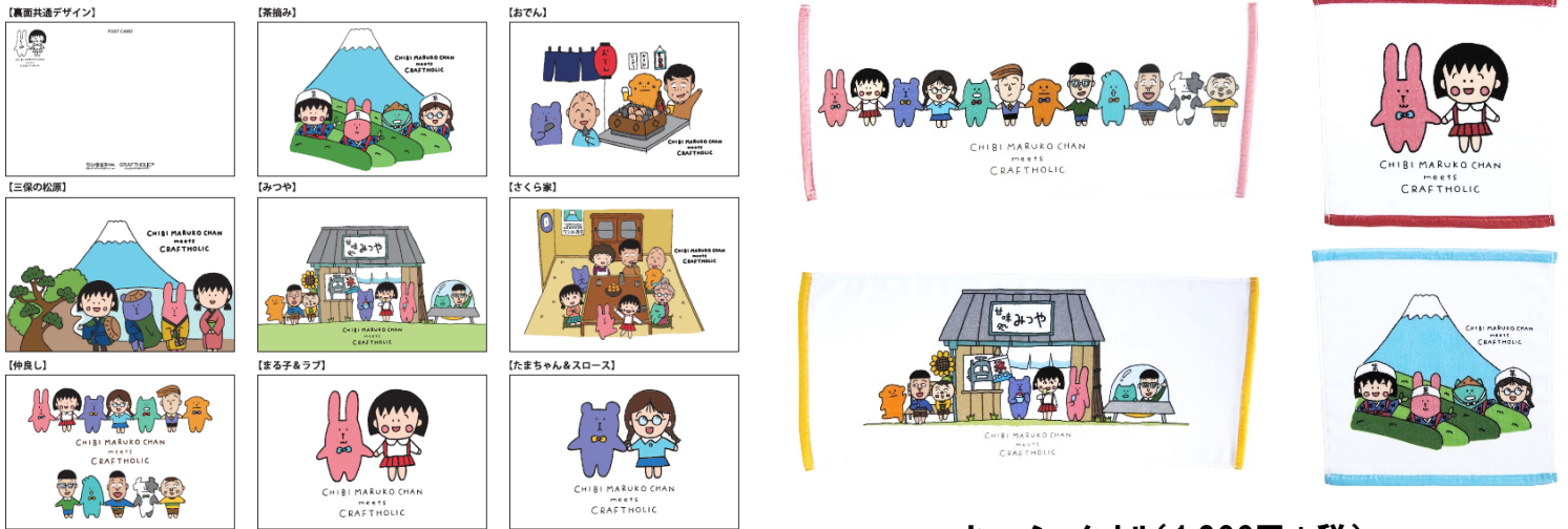
ポストカード(全8種・各250円+税)