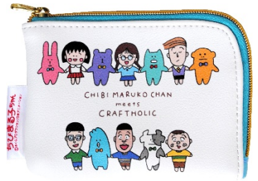
コインケース(1,500円+税)