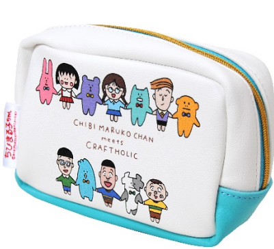
ティッシュケース付きポーチ (2,100円+税)