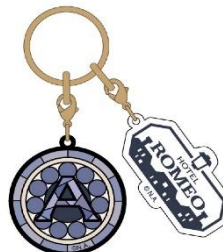
アクリルイニシャルキーホルダー 2種 各900円