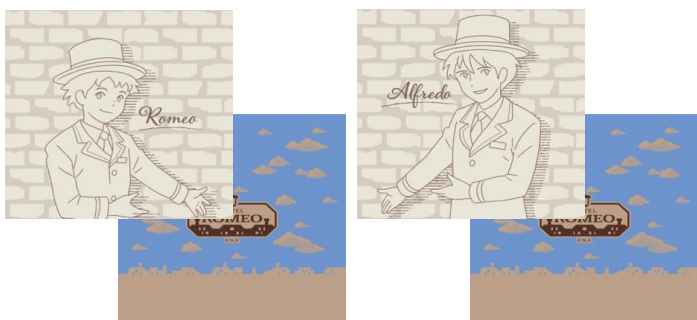
クッションカバー 2種 各3,800円