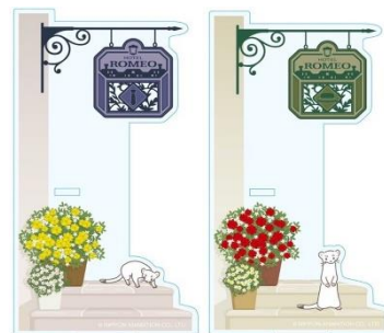
アクリルペンスタンド 2種 各1,800円