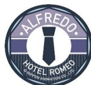
缶バッジ 2種 各400円