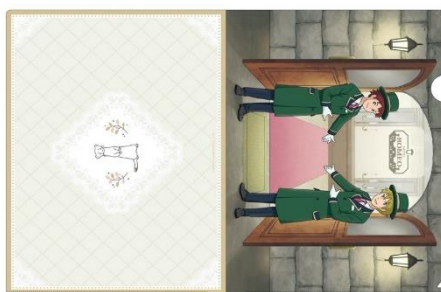
クリアファイル 500円